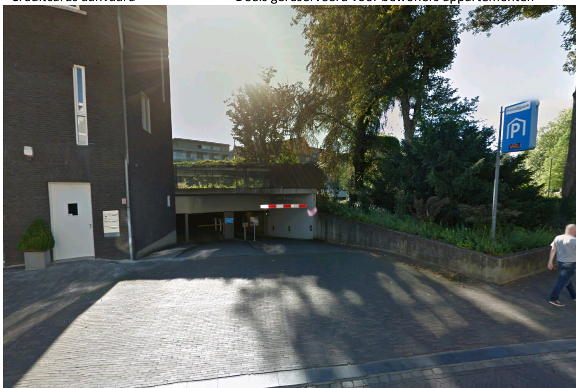
Ingang overdekte parkeergarage Proosdijpark