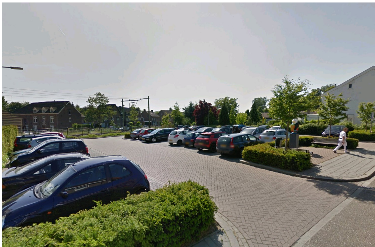
Parkeerplaats Gansbaan parking