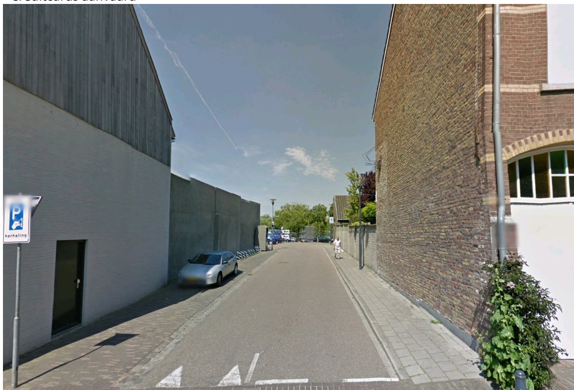
Ingang Kuileneindestraat parkeerplaats 't Bergske