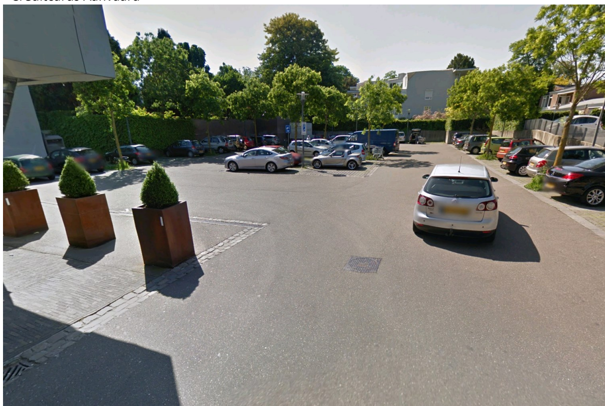
Parkeerplaats 't Gasthoes